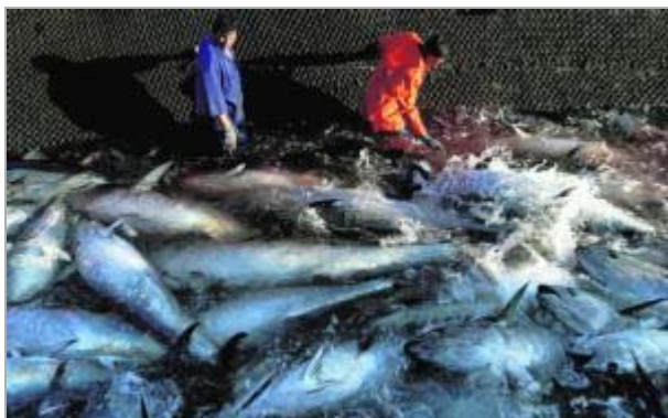
La almadraba, tradición en la pesca del atún rojo en el Mediterráneo