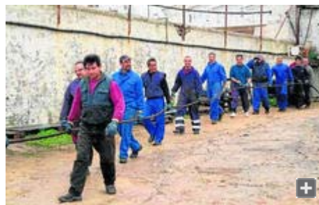
Los almadraberos de Tarifa comenzaron ayer los preparativos en tierra para poder calar las artes.

La Comisión Europea (CE) hizo ayer oficial su respaldo al veto del comercio internacional del atún rojo pero propuso por lo menos un año de plazo (hasta marzo de 2011) antes de que se haga realidad la restricción. Bruselas pidió el apoyo de los Veintisiete para que la UE pueda defender esa prohibición en una sesión de Convención del Comercio Internacional de Especies Amenazadas de Fauna y Flora Silvestres (Cites), que se celebrará entre el 13 y el 25 de marzo en Doha (Qatar).