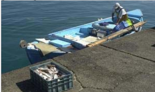
El 90 por ciento de la flota canaria tiene menos de 12 metros de eslora. En la imagen, un pescador