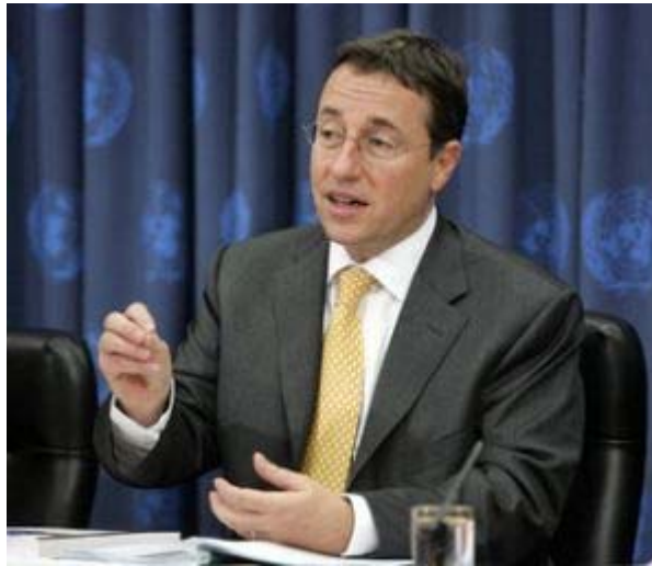
El director ejecutivo del PNUMA, Achim Steiner.

Los Mares del Asia Oriental – que incluyen la región entre China, la República de Corea y Australia – concentra algunos de los niveles más altos de actividades de transporte marino y de barcos de captura del mundo. Representan el 50% de la producción pesquera global y el 80% de la producción acuícola global.