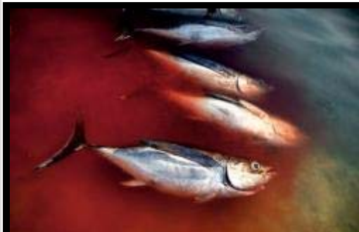
Japón tiene sushi para dos años

El Gobierno japonés no está precisamente contento con la propuesta de prohibir el comercio internacional de atún rojo para proteger la especie del colapso comercial . El embajador de este país en España, Takahashi Fumiaki , se ha mostrado partidario de apoyar las restricciones impuestas por los organismos internacionales de gestión pesquera, es decir, seguir aprobando cuotas de pesca, aunque sean reducidas. Pero más allá de la declaración política, Japón no está preocupado por el suministro de atún , estrella del sushi. Además del atún rojo fresco que cada día se subasta en el mercado de Tsukiji de Tokio, el país nipón tiene miles de toneladas de ejemplares congelados, es decir, un consumo asegurado de al menos dos años, según los expertos.