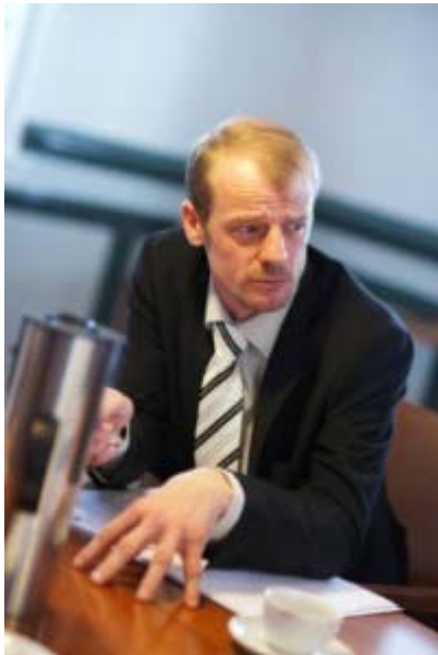
Ministro Jorgen Niclasen de las Islas Faroe.

La Islas Faroe se unieron a Groenlandia en una protesta en contra de la cuota de 334 toneladas de langostino en una sección de las aguas internacionales de Terranova, llamada 3L.